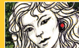
PRIMISSIMO PIANO (PPP)