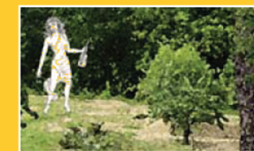
CAMPO MEDIO (CM)