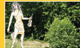
FIGURA INTERA (FI)