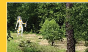
CAMPO TOTALE (CT)