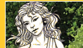
PRIMO PIANO (PP)